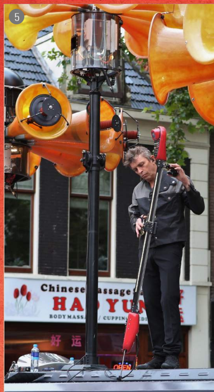
Le Sirénium - Instrument de lutherie mécanique créé pour interpréter, improviser et jouer les Sirènes en live !